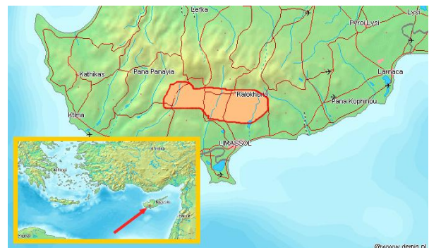
Produktionszone der Commandaria → Klicken Sie auf das Bild, um es zu vergrößern

In seinem Buch „Cyprus - How I saw it in 1879“ liefert der 1893 verstorbene Afrikaforscher Samuel Baker wichtige Informationen über die mehrjährige Produktion der Commandaria . Am Ende des XIX. Jahrhunderts wurden 385'000 Liter produziert, wobei fast 2/3 davon mehrheitlich nach Österreich exportiert wurden. 1990 wurde das Weingebiet geschützt und zu den 14 Gemeinden eingeschränkt, die höher angedeutet wurden. 2002 wurden ca. 211'000 Liter Commandaria exportiert, 2004 ca. 189'000.